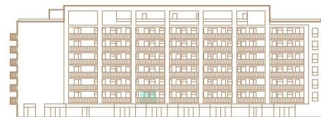
2. nadzemné podlažie