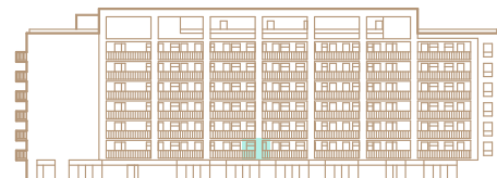
2. nadzemné podlažie