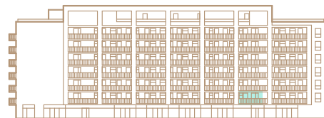
2. nadzemné podlažie