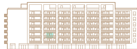
3. nadzemné podlažie