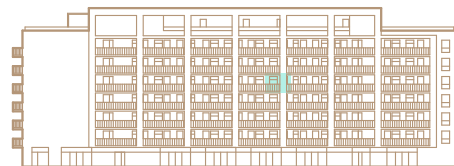
5. nadzemné podlažie