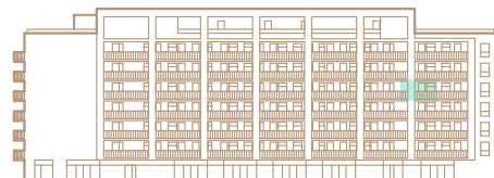
5. nadzemné podlažie