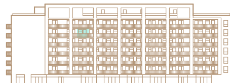
6. nadzemné podlažie