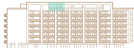
8. nadzemné podlažie